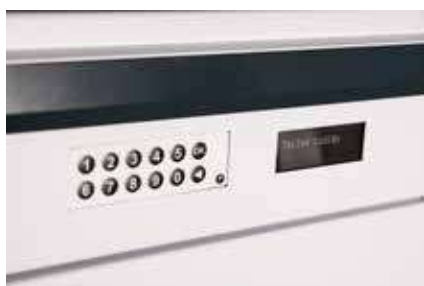
Detalle frontal iPackBox Plus. Bocacarta, teclado y pantalla.