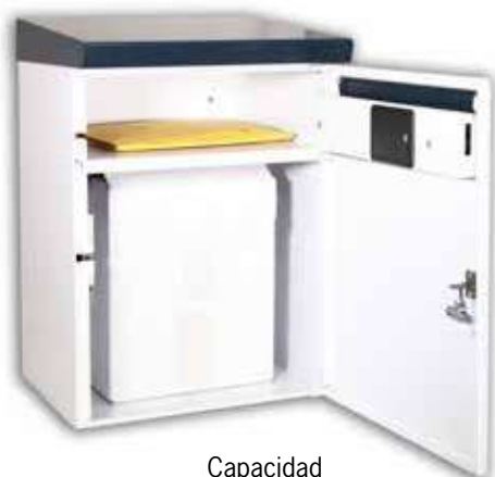
Capacidad iPackBox Plus